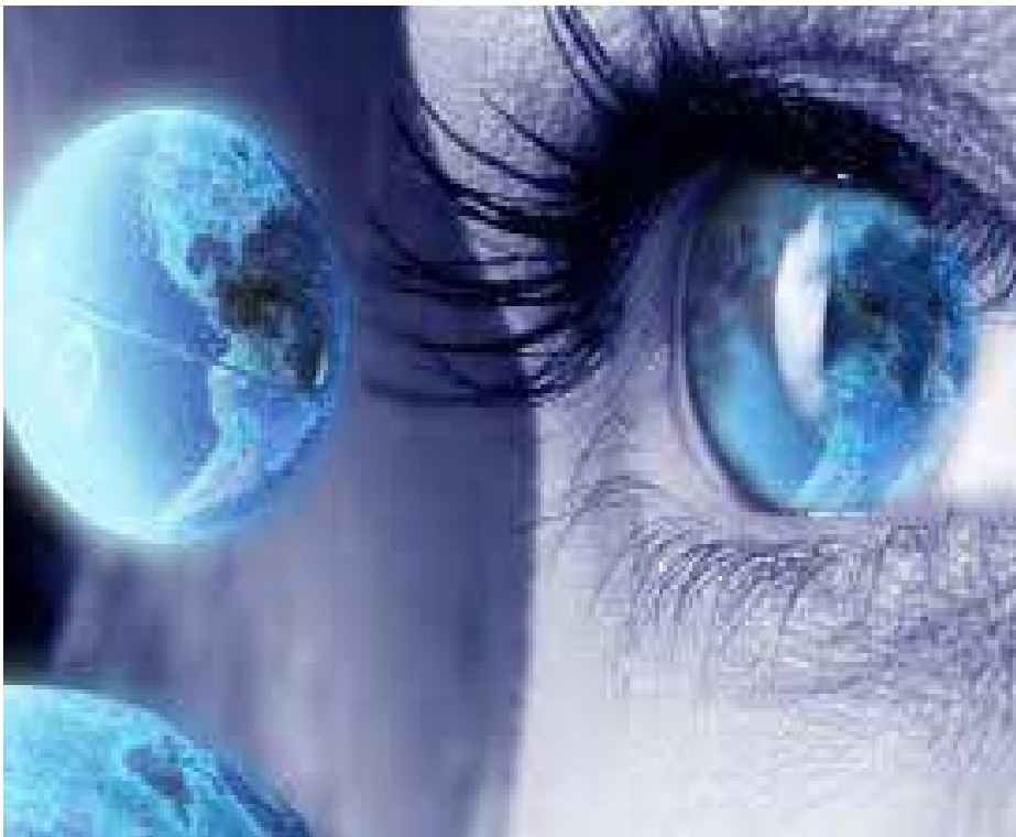
Aposta na vanguarda

“Os acidentes acontecem devido a instalações defeituosas, vamos evitá-los de futuro”