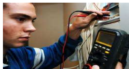
Técnicos certificados para todas as intervenções