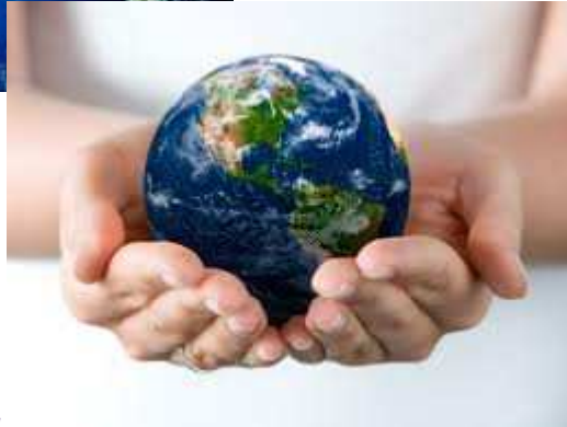
A ENVIVA no mercado Internacional

“...os melhores produtos e serviços, aos melhores preços sempre com o profissionalismo e honestidade a que estão habituados.”